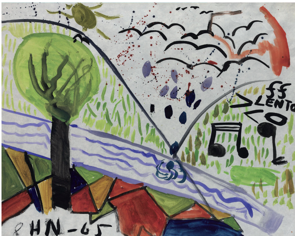
Målning av Håkan 11 år gammal.

Det skymtar inte bara fram i de notsymboler som Håkan använde sig av i en av sina målningar (se bilden), utan på ett foto från julen 1964 där Håkan agerar sångare med mikrofon i hand i vad som kan vara ett låtsasband i en källare i kvarteret. En kamrat hanterar en gitarr, och en tredje bandmedlem håller en skylt med bandets namn: "The Buttons".